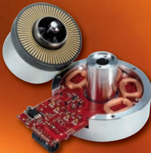
Direktantrieb mit Spulen und Antriebselektronik im Alu-Block, wartungsfreies Ölbad-Wälzlager, darüber der Ringmagnet mit Tachoscheibe

Eine Freundin, die mit der Fotografin Herlinde Koelbl zusammenarbeitet, stand eines Tages wie angewurzelt vor dem Spieler, bestaunte ihn fasziniert: „Ist der schön!“ Doch das Sichtbare hat nicht nur eine optische Wirkung, es besitzt auch einen klanglichen Hintergrund. Die abgerundeten Ecken mögen Assoziationen an Kunstwerke wecken oder Plattenspieler-Liebhaber an die Rundungen des klassischen Thorens 124er, einen