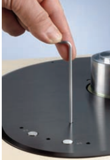
Klanglich extrem wichtig sind die Stellfläche oder Füße direkt unter den höhenverstellbaren Spikes

Hebt man den Oasis erstmals hoch, staunt man: Auf 27 Kilogramm kommt der Spieler mit seinem zehn Kilo schweren Teller und dem massiven Aufbau – lediglich sechs Kilo weniger als das vergleichsweise monumental wirkende LaGrange-Laufwerk. Aber das ist mal wieder ein typisches Brinkmann-Ergebnis: Ziel der Entwicklung war ein kleiner, günstiger Plattenspieler, dann sprechen verschiedene klangliche Notwendigkeiten für einen schweren Teller. Und schon bewegt man sich in einem Entwicklungsstrudel, der her-