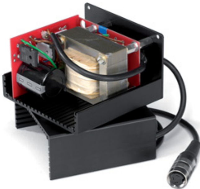
Dieses Netzteil in Halbleitertechnik gehört zum Lieferumfang. Mitte nächsten Jahres soll aber auch für den Oasis ein Röhrennetzteil erhältlich sein

Die Entscheidung für den ersten direktgetriebenen Brinkmann-Plattenspieler fiel also recht früh in der Entwicklungsphase. Doch die zog sich dann deutlich länger hin als erwartet, denn trotz intensiver Suche ließ sich kein den Anforderungen entsprechender Motor am Markt finden. Die Kon-