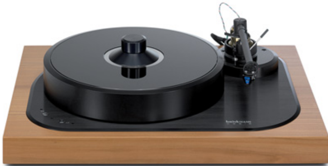
Auf den ersten Blick wirkt der Oasis wie ein ganz konventionelles Laufwerk. Er vereint aber einen Zehn-Kilogramm-Teller mit einem Direktantrieb

Chassis des Avance, das bündig in einen Massivholzrahmen eingepasst ist, rechteckige Konturen auf, während die schwarz eloxierte Aluminiumplatte des Oasis ein wenig über die Holzumrahmung hinaussteht und unterschiedliche Radien statt rechtwinkliger Ecken darauf schließen lassen, dass das Chassis schon durch die Formgebung resonanzoptimiert